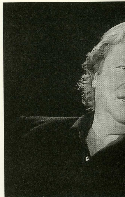
Jan Stenbeck, Stim